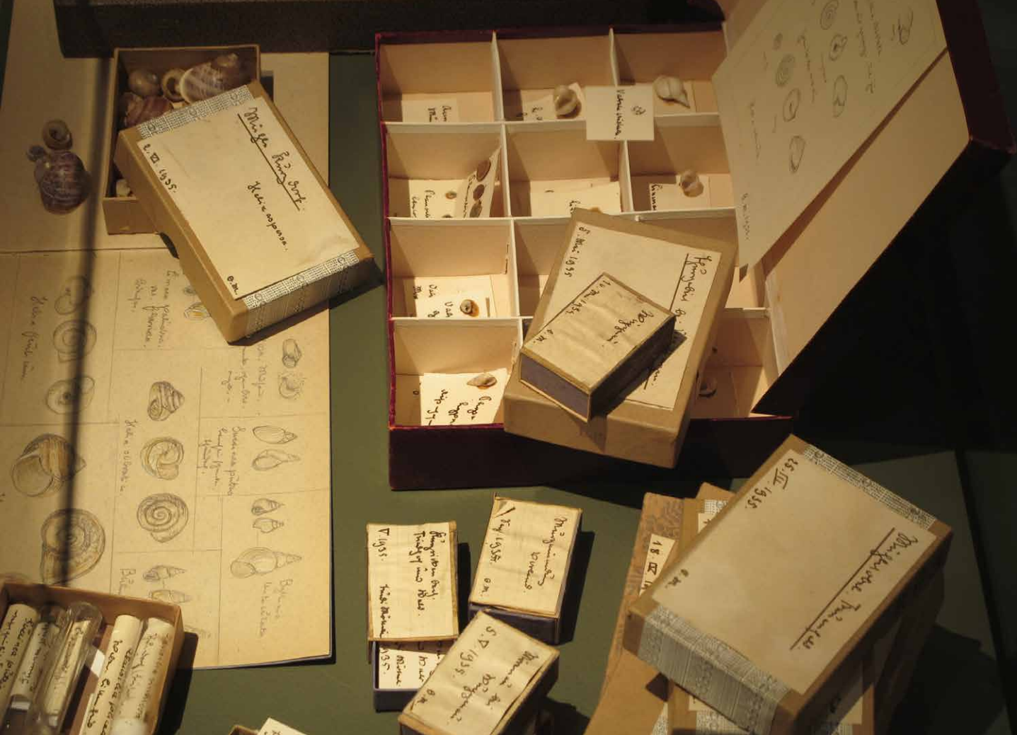
Olga Möttelis Sammlungsarbeit zeichnet sich durch Sorgfalt und Genauigkeit aus.

ein Fundkatalog, der mit ca. 1400 Pflanzenarten die Grundlage für die heute rund 46'000 Datensätze zu Gefässpflanzen umfassende Datenbank des Naturmuseums darstellte. Dieser Kraftakt musste sie, neben ihrer angeschlagenen Gesundheit und der bedrückenden Stimmung der Kriegsjahre, erschöpft haben. Anfang 1944 begab sich Olga Mötteli aufgrund von Depressionen nach Zürich in Behandlung. Im April 1944 nahm sie sich dort das Leben.